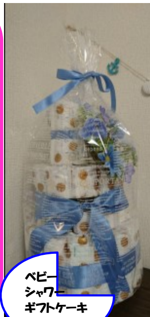
ベビー シャワ ギフトケーキ

遊具で遊んだり、ベビーマッサージをしたり、リズム遊びや絵本の読み聞かせ子育てに関する色々な情報共有して、どの子どももスクスク育つ場を、児童館や幼稚園、保育園、こども園と共に、地域の子育てプチ広場を開いています。最終週月1ママカフェを提供しています